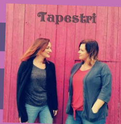
Arbed Dy Gariad – Tapestri