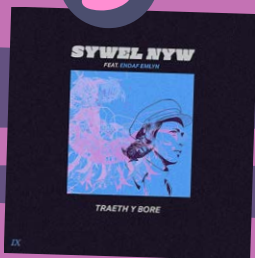
Traeth y Bore – Sywel Nyw gydag Endaf Emlyn