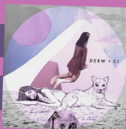
Ci – Derw