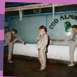
Llyn Llawenydd – Papur Wal